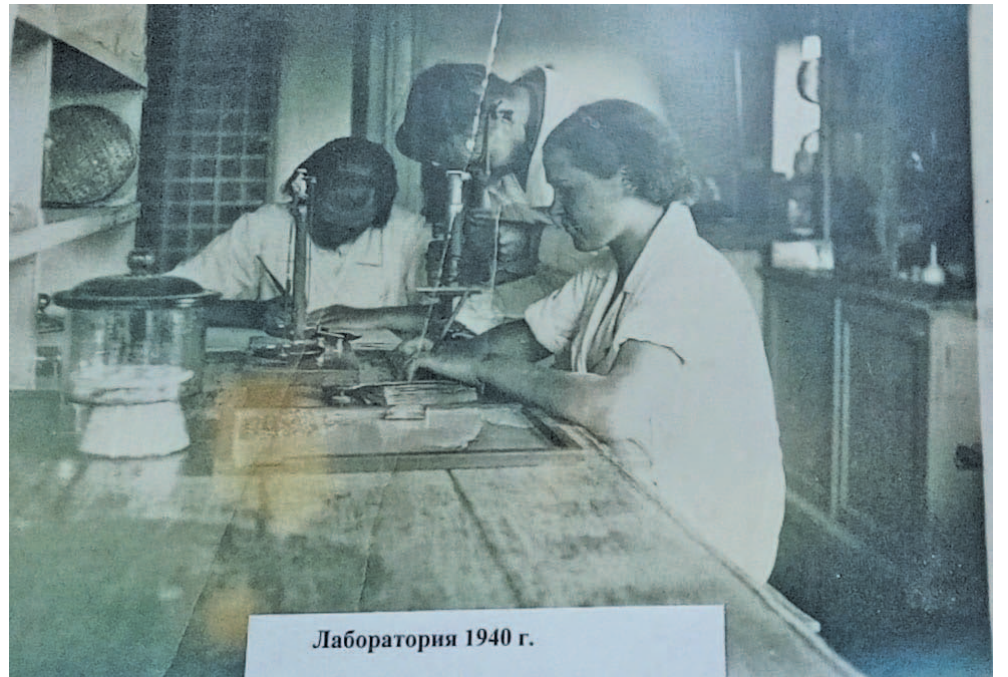
Лаборатория 1940 г.